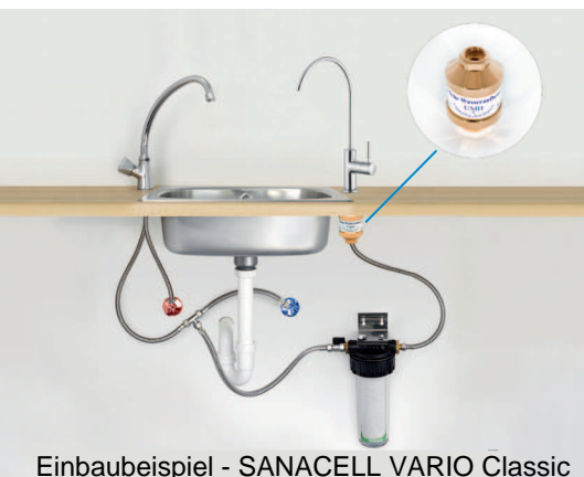
Einbaubeispiel - SANACELL VARIO Classic

Ich möchte mich bei Ihnen auf diesem Weg recht herzlich für ein echtes Stück Lebensqualität bedanken. Ich benutze Ihre Produkte mittlerweile seit mehr als zwei Jahren. Sie wissen von meinem Wunsch mich möglichst natürlich zu ernähren, und ich kann heute wirklich sagen, dass ich mich mit meinem Wasser sehr sicher fühle. Mit meinem Untertischfilter bin ich bis heute ausgesprochen zufrieden. Den „Frischekick“ des UMH Wirblers genieße ich wie am ersten Tag. Ich möchte heute kein anderes Wasser mehr trinken.